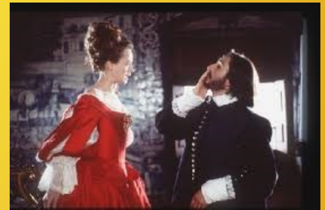
El perro del hortelano